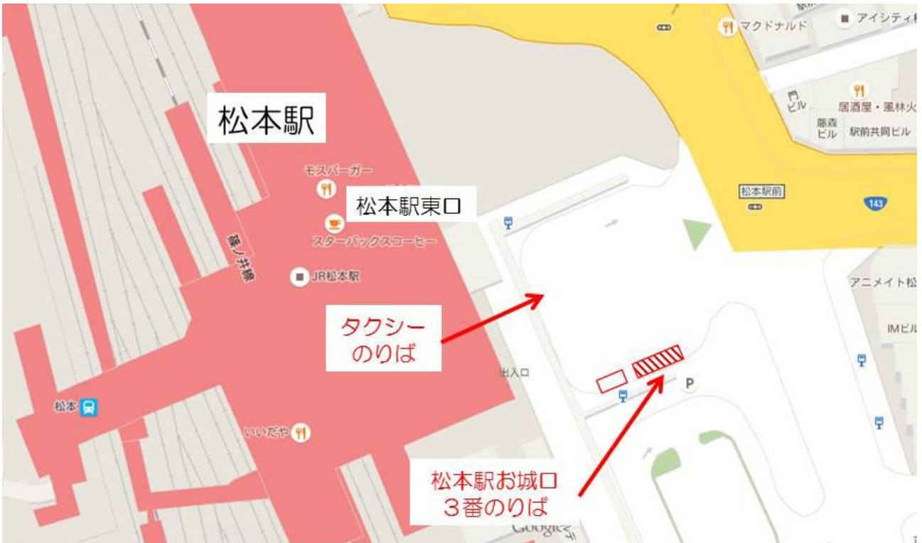
松本駅お城口 3 番のりば