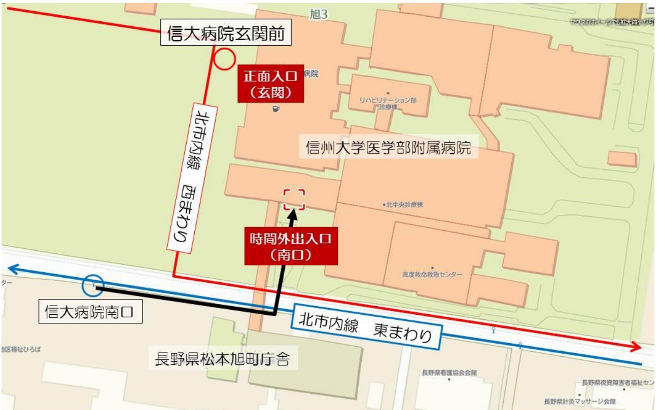
信州大学病院周辺のバス停および会場入口(時間外出入口)